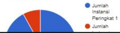
Grafik Kinerja Instansi